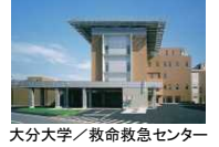
大分大学ノ救命救急センター