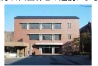
京都工芸繊維大学ノートルダム館 企業との連携による整備