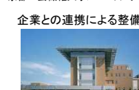
大分大学ノ救命救急センター