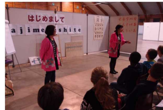
事業例③: 日本語ワークショップ