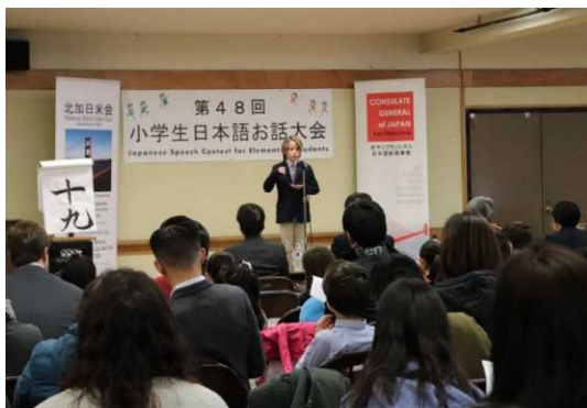
事業例①: 日本語弁論大会

在外公館では、日本の伝統文化から漫画・アニメ等ポップカルチャーに至る幅広い日本文化の紹介事業を実施。令和元年度には、日本語教育関係事業として、日本語学習者の学習意欲の維持・向上を目的にした「日本語弁論大会」等約120件を実施。