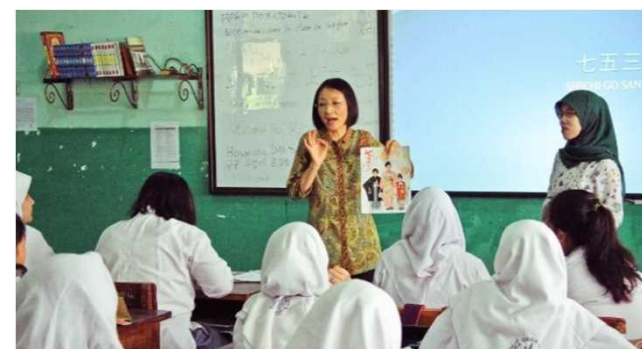
教室でのパートナーズ活動様子（インドネシア）