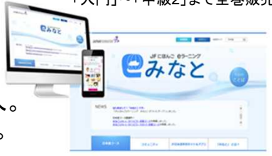
日本語をいつでも、どこでも学べます

インターネットを通じた学習支援を目的として、オンラインコースの運営や学習管理を行うための日本語学習プラットフォーム「みなと」やモバイル端末向け学習アプリを開発・提供。