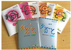
「入門」～「中級2」まで全巻販売中

「JF日本語教育スタンダード」※に準拠した学習教材『まるごと 日本のことばと文化』などの教材を制作。【販売部数:56か国で86,168部。累計販売部数:約38万部】