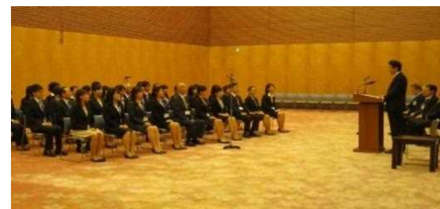
第1期パートナーズ派遣前に安倍首相を表敬訪問