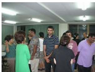
二重の輪になって自己紹介