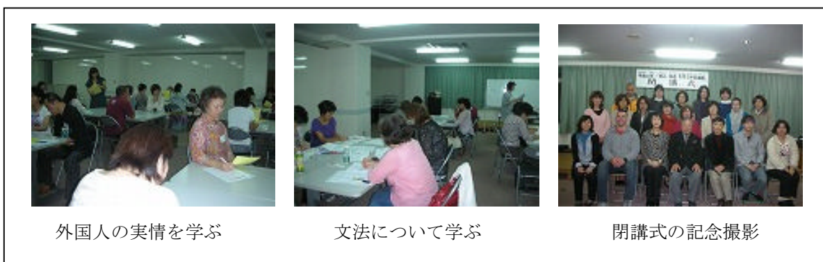
外国人の実情を学ぶ

内容 毎回感想に復習が必要、とみな書いていたので、今日はまとめの意味で、動詞の種類の違いや形容詞の種類プリントを最初にする。前のプリントを見返してもなかなか答えが埋まらない。一通り答えあわせをしてから、今日のテーマである「表記・発音」に移る。ひらがな、カタカナの導入上の注意や、間違えやすい理由などを学ぶ。また、「じ・ぢ、ず・づ」のルールなどは初めて聞いたという人もいた。発音では、「ん」の種類や促音・拗音・長音の発音の難しさ、ミニマル・ペアでの練習方法などを学んだ。最後に講師から、けっして文法を完璧に理解しなければ教えられないということではないし、むしろ外国人が疑問に思う点から日本語のおもしろさに気付くことが多く、日本語を深く知ることになればいいと思うという励ましの言葉に、みな肯いていた。