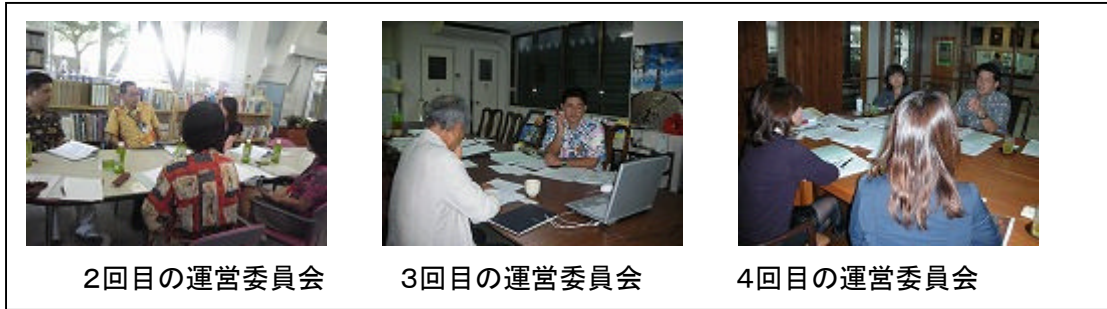
2回目の運営委員会