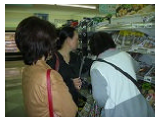
ジャスコで商品をチェック