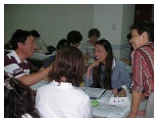
学習者同士も助け合う