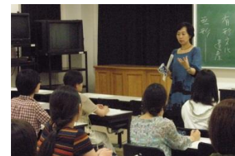
女性のグローバルな活躍のためのワークショップ

グローバル人材育成推進センターを立ち上げ、グローバル人材育成に特化した科目群を設置するとともに各学部で英語による専門教育を導入。また、海外の女子大学とのネットワーク拡充による交換留学プログラム増大や国内外の企業体験等の機会増大など多様な取組を通じてグローバル力の強化を図る。