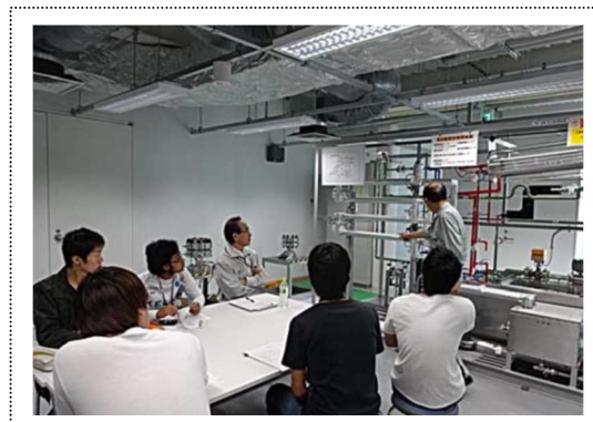
沸騰実習風景 （原子力体感スクールで実施した熱流動実験装置を用いた実習の様子）