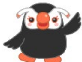
「エリカちゃん」 北方領土問題啓発キャラクター