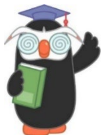
「エリカちゃん」のお友達の「エリヨシくん」