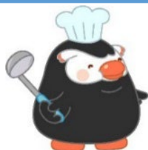
「エリカちゃん」のお友達の「エリマルくん」