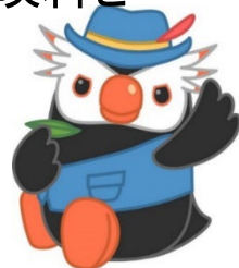
「エリカちゃん」のお友達の「エリオくん」