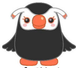
「エリカちゃん」 北方領土問題啓発キャラクター