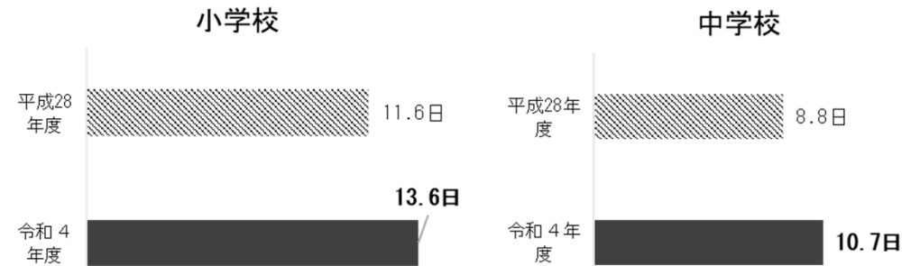
②教師の有給休暇取得日数(年間・平均)