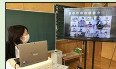
臨時休業時にオンラインで授業を行う様子