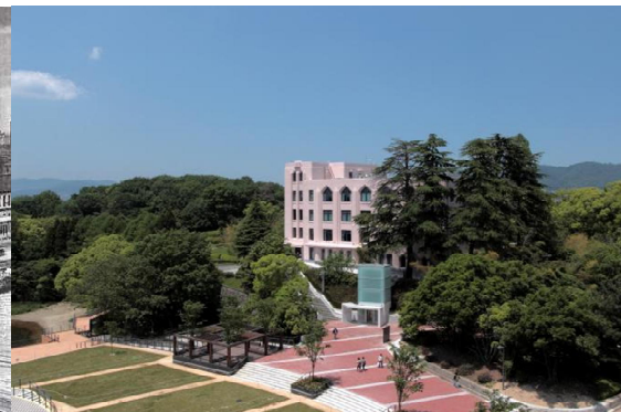
現在の豊中キャンパス