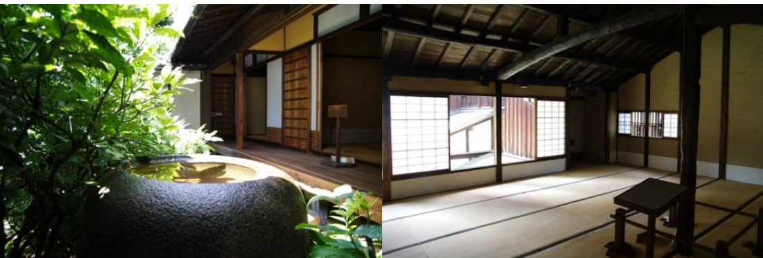
史跡・重要文化財 適塾(左:庭、右:学生大部屋)