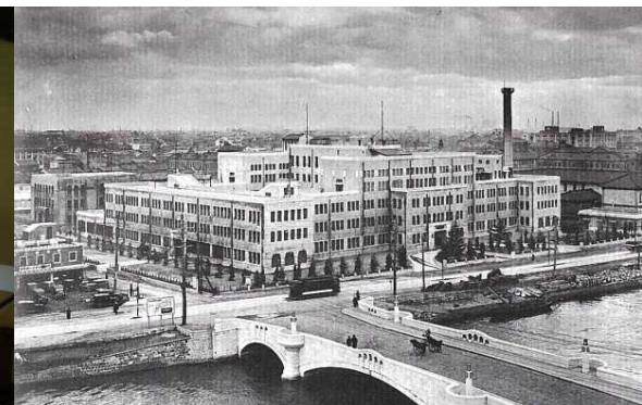
大阪市中之島にあった開学当時の医学部