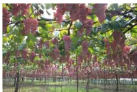
日本一の生産量を誇る棚式栽培による ブドウ畑