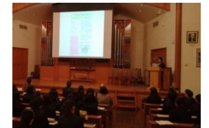
ユネスコスクール