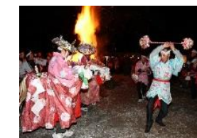
一之瀬高橋の春駒