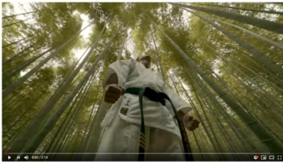
～「BUDO Tourism Japan - The Spirits of BUDO」～ 3,249,183 回視聴