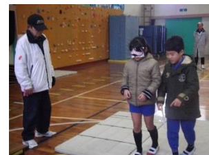
2人組でのアイマスク体験

5年生の車椅子バスケットボール大会への出場を受けて、障害のある人や高齢者に対する理解と認識を深めるために、4年生が「福祉体験学習」に取り組んだ。アイマスクを付けて目が見えない状態をつくり、不安定なマット上を歩いたり、狭い通路を通ったりする