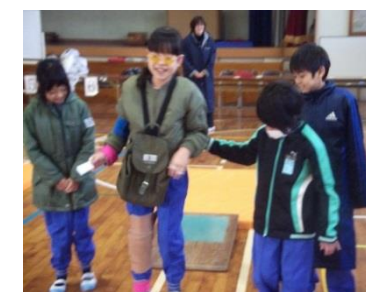
身体が思うように動かせない体験をする4年生

「アイマスク体験」。耳栓や視野が狭くなるメガネをかけたり、関節が自由に動かなくなるようなサポーターや手首・足首・お腹におもりを装着したりする「高齢者体験」。それぞれの体験により、障害をもった方やお年寄りが生活する上での苦労や工夫を知ることができた。また、体験を通して感じたことを基に障害をもった方たちと共生する社会について、さらに来年度の取組につなげる。