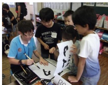
筆のもち方や筆遣いを教える3年生

3年生は、事前に一つ一つの道具の名前をローマ字で書いたカードを作成し、それを示しながら道具の使い方を身振り手振りで説明していた。3年生は、改めて筆の使い方や筆遣いを確認しながら、タイの子どもたちに習字を教えていた。