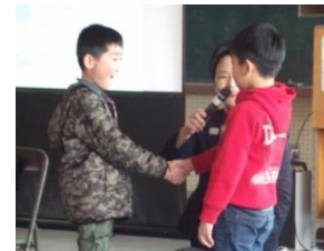
握手は右手で相手の目を見てギュッと握る

とくに、「挨拶は相手に何と言っているかが分かるように顔を上げたまま言葉を発し、その後、頭を下げること」については、教えていただいてすぐに行動に移し、気持ちのよい挨拶をする姿が見受けられるようになった。