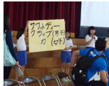
歓迎集会でタイ語を披露している様子