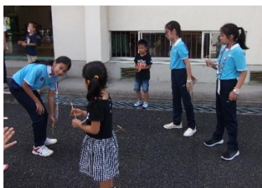
タイの小学生と竹とんぼをする1年生

1年生は、毎年、地域のボランティアによる「昔遊び体験」を実施している。今年も「はねつき・けん玉・あやとり・お手玉・竹とんぼ・折り紙」を教えていただいた。今回は、タイのお友達に教えてあげてことを意識して取り組んだ。