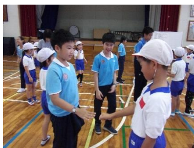
出会いのゲームをする2年生

音楽では、タイを代表する動物であるゾウについて学習するとともに、日本語とタイ語で「そうさん」の歌を練習して、タイの子どもたちと合唱した。