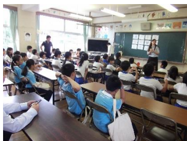
ALT を中心に英語による自己紹介 (外国語活動)