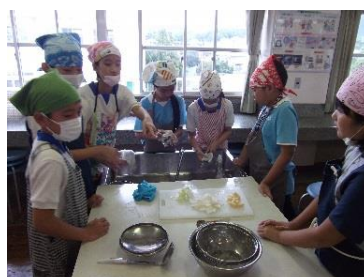
お米をとぎながら、タイと日本のお米の違いについて話している5年生

◇事後学習：各学年が、実際にタイの子どもたちと授業等で交流したことを振り返る時間を設定した。言葉や文化の違いを実感するとともに、国が違って互いを理解しようとする気持ちやその気持ちが伝わったときの喜びを表現する子どもが多く見受けられた。北九州市はタイのオリンピック・パラリンピック選手のホストタウンである。本取組での出会いを大切にすること、2020年に向けて一人一人ができることを実行に移すことがオリンピック・パラリンピックの成功につながることを確認した。