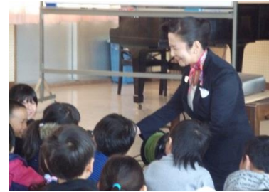
江上先生におもてなしの心を教えていただいた2年生

東京オリンピック・パラリンピックが開催される2020年には5年生として長尾小の要となる2年生を対象に、筑波大学客員教授：江上いずみ先生を講師としてお招きし、「おもてなし講座」を実施した。「おもてなし」は、相手に喜んでもらうことをして差し上げること。おもてなしと思いやりの心をもって人と接すると相手も自分も周りの人もいい気持ちになれることを教えていただいた。