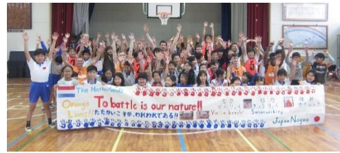
交流試合後に、オランダ選手と一緒に記念撮影

交流会の司会グループ、横断幕作成グループとそれぞれの役割を担い、準備を進めることで、主体的・創造的・協同的に取り組む姿が随所に見受けられた。