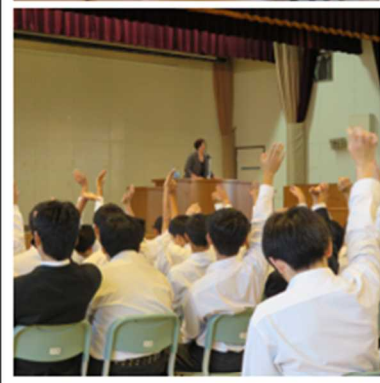
○健全育成推進会講演会の様子。 (ブラインドサッカーの紹介)