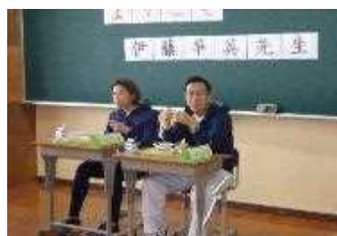
事〔親子ふれあい講演会〕