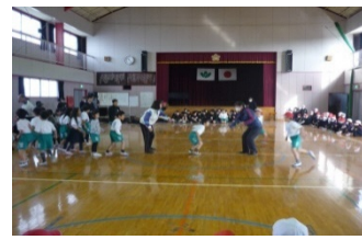
長縄オリンピックの様子