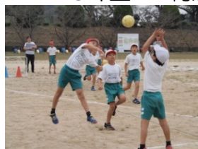
4年生ハンドボール