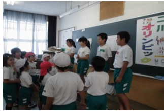
二川オリンピックの様子