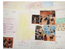
3年のつくったパンフレット