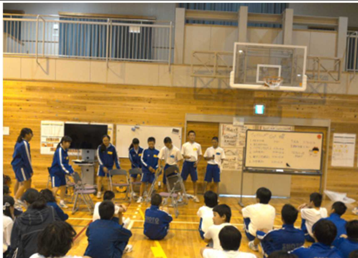
ゲーム2 バクダンカルテット