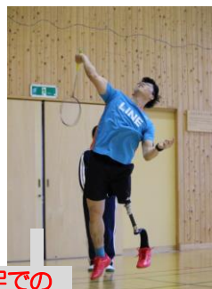
片足での ジャンピングスマッシュ

後半は、実技を披露していただいた。職員との対戦では、会場が笑いに包まれ和やかな雰囲気であったが、バドミントン部の生徒との打ち合いでは、義足でプレーしていることを忘れさせる素晴らしい技術を披露していただき、白熱した実践を目の当たりにすることができた。中学生への熱いメッセージが心に届いた一日となった。