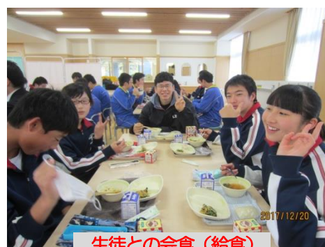
生徒との会食(給食)