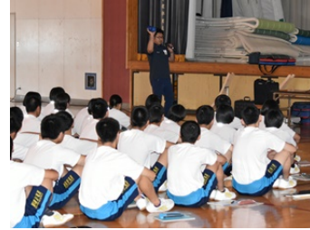
生徒たちが熱心に 講演に聴き入る様子