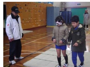
2人組でのアイマスク体験

5年生の車椅子バスケットボール大会への出場を受けて、障害のある人や高齢者に対する理解と認識を深めるために、4年生が「福祉体験学習」に取り組んだ。アイマスクを付けて目が見えない状態をつくり、不安定なマット上を歩いたり、狭い通路を通ったりする