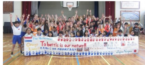
交流試合後に、オランダ選手と一緒に記念撮影

交流会の司会グループ、横断幕作成グループとそれぞれの役割を担い、準備を進めることで、主体的・創造的・協同的に取り組む姿が随所に見受けられた。