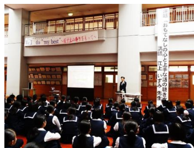
<おもてなし講座の様子>