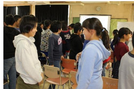
目と目を合わせて挨拶の練習