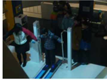
館内体験コーナーに挑戦