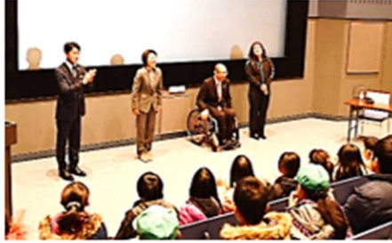
ミュージアムでの講演の様子