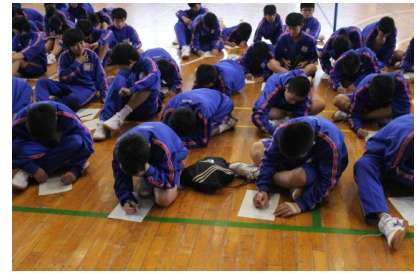
(写真4:感想用紙の記入)