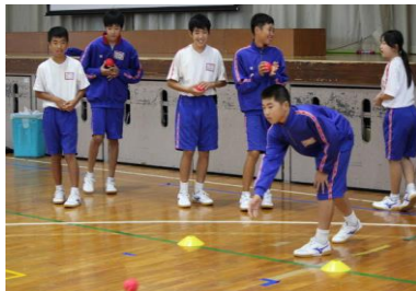
（写真1：ボッチャ 団体戦の様子）

授業後に、「次はいつやるんですか」という声が聞かれ、興味関心の高まりが感じられた。