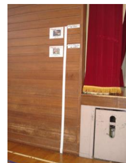
(写真5:走り高跳びの掲示)