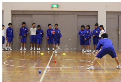
（写真2：戦略を指示する生徒）