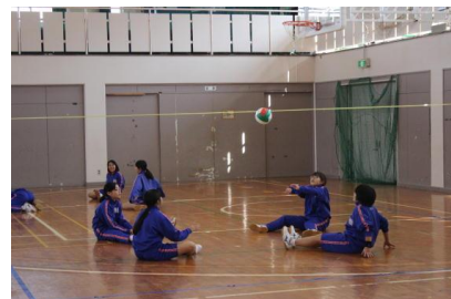
（写真3：シッティングバレーボール）