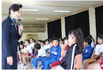
低学年にも分かりやすい授業