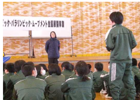
【大山さんへの質問コーナー】