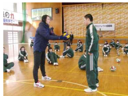
【ボールが床に落ちる前に触れる】