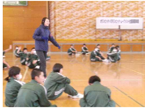
【グループでのパス練習】