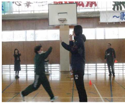
【じゃんけん勝ち抜き走】