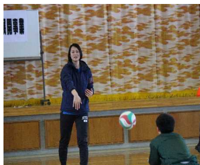
生徒のレシーブ体験】