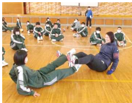
【足だけでボールを扱う】