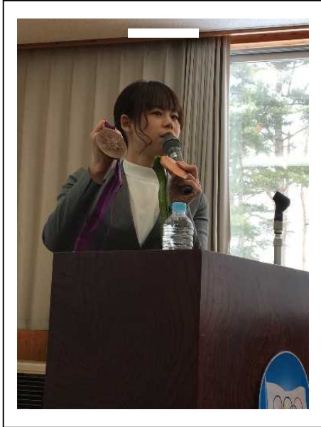
【 銅メダルを手にお話される星さん 】

1月30日(火) 5校時、オリンピックの星奈津美さんをお迎えし、「水泳が私に教えてくれたこと」と題して講演会を行った。