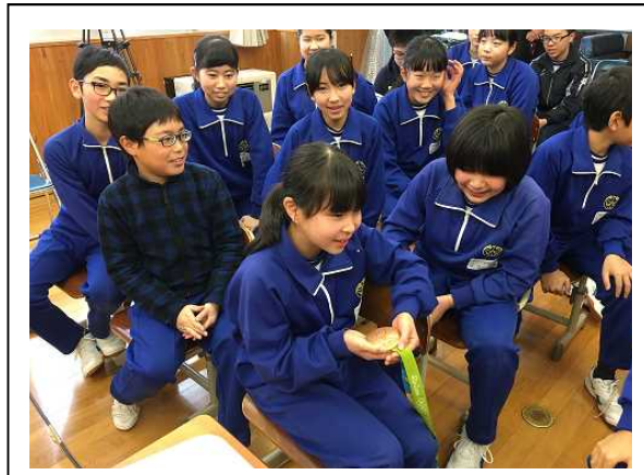
【 重い！銅メダルを手に重さを実感する児童 】