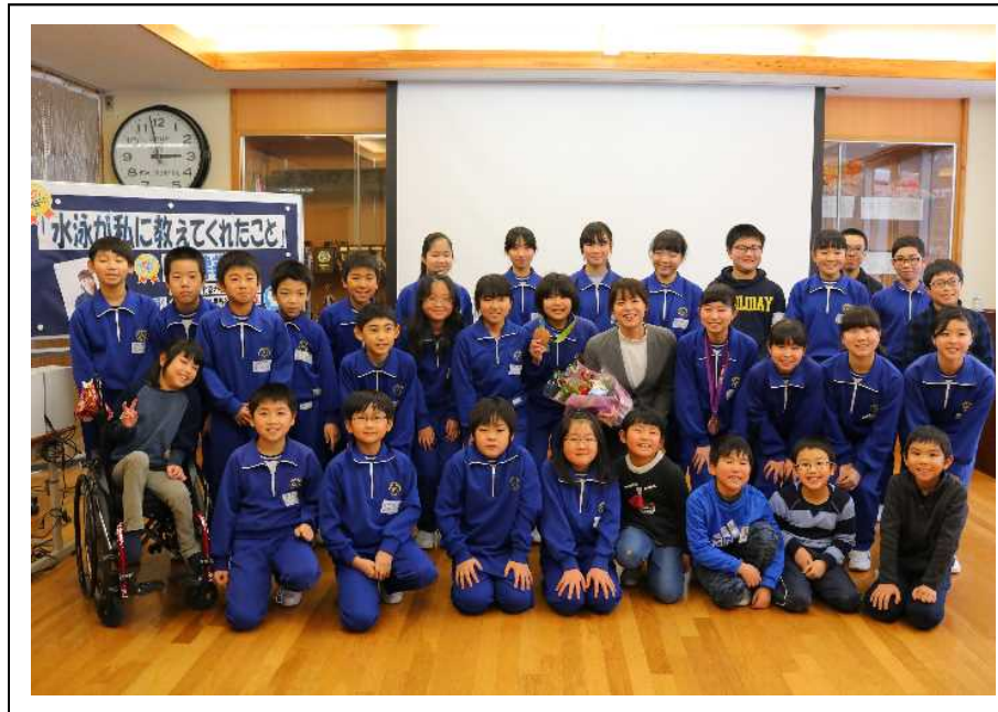
【 星さんと記念撮影 】