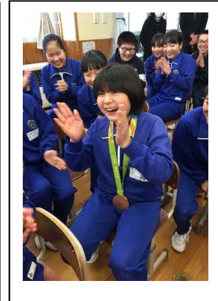
【 将来はメダリスト！ 】