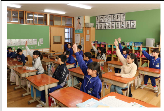
【 東京大会マスコットを検討中 】