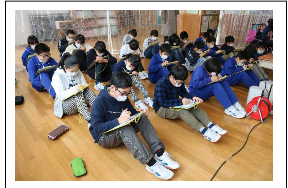
【 事前学習に取り組む児童 】