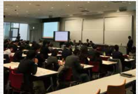
「日本版NCAA創設に向けた学産官連携協議会」へ参加

また、他学や他機関で開催される日本版NCAA創設に係るシンポジウムやセミナーなどにも積極的に参加し、本学の取組などを中心に、現在の学産官連携協議会が検討・協議をしている事項についての周知・啓発に取り組み、上述のDASHサイトでのパブリシティに務めている。