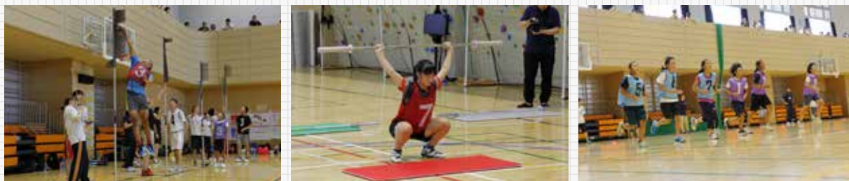
ジャパン・ライジング・スター・プロジェクト(2017年8月20日開催)

また2017年度は、スポーツ庁や日本スポーツ振興センターが推進し、同センターから日本体育協会が「競技力向上事業」の一環として受託した、全国の将来性豊かなアスリートを発掘するためのプロジェクト「ジャパン・ライジング・スター・プロジェクト(J-STAR PROJECT)」のオリンピック種目「測定会」の会場貸与と運営協力を行った。これも先の和歌山県の事例を同様に、本学内での開催による施設や設備、人材を活用した収益事業化は当然のことながら、体育・スポーツの専門機関としてのスポーツ施策への協力と、学生スタッフを活用することによるスポーツ活動や事業の実践学習機会の創出と本学経営資源のPRを兼ねて「拠点づくり」を可視化する事業である。