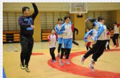
和歌山ゴールデンキッズ合宿(2018年2月11・12日開催)