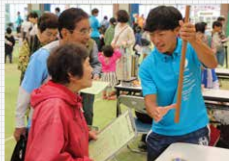
たじり健康フェスタでの学生による体力・運動能力測定会

15日に同町主催の「たじり健康フェスタ」でお披露目され、三島准教授や同研究室学生も参加し、住民へのデモンストレーションを一緒に行うと共に、体力・運動能力測定会も実施。町の健康づくり施策への協力に取り組んでいる。次年度にむけては、継続的に田尻町と議論を進め、町民が継続的に体操へ取り組める環境の整備や、体操のさらなる普及・啓発などに取り組むと共に、体操普及や実施に伴う効果測定（認知症予防など）や検証など、町が行う施策へのさらなる協力を進めていきたいと考えている。