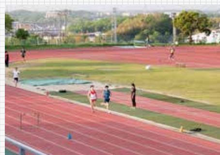
全天候400mトラックを有する陸上競技場

この環境は、競技種目に特化したスポーツ科学研究を行うこともでき、そこで明らかにされた知見からは、パフォーマンスの評価やトレーニング内容の提案に役立っている。