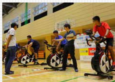
ボート競技・新規・種目転向型～トライアウト (2016年8月27日開催)

1)と同様、体育・スポーツの専門大学である本学では、競技団体や統轄団体との協業を本学内で行うことは先にあげた「拠点づくりビジョン」の具現化のみならず、それに参画する学生自身の主体的かつ実践的な教育の場を提供することにもつながり、「体育やスポーツ科学の実践」および「スポーツ事業」という実学を学べる重要な教育施策や機会として認知している。したがって、これまで日本ボート協会や大阪ボート協会に協力する形で2016年度には「タレント発掘・一貫指導育成