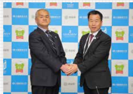
熊取町と協働協定締結(2018年3月2日)

2018年3月2日、本学と本学所在地である大阪府泉南郡の熊取町と「少子高齢化、人口減少社会の到来を迎え、熊取町と大阪体育大学は住民の健康増進および町の活性化を図るため、運動・スポーツを通じて、永く楽しく元気に暮らせるまちづくりを協働で推進する」ことを目的として、以下の5つの事項について連携協定を締結した。ボート競技は、国際競争力では依然として格差があるものの、タレント発掘などを機会とした種目転向選手による、短期間での世界選手権などの国際大会出場という展望も描くことができる。比較的、競技寿命が長いこともあり、大学生やそれ以降での競技への挑戦の可能性もあるということで、本学や併設校の中高の学生アスリートの世界レベルの種目する機会提供ということにも資するのではという戦略をもって引き続き取り組んでいる。