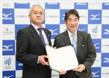
ミズノ株式会社との連携協定締結

また2018年3月22日に連携協定を締結したミズノ株式会社とは、以下の5つを連携協力の事項として、スポーツや健康づくりを通じた事業展開の促進を両者の協働を通じて推進する予定である。