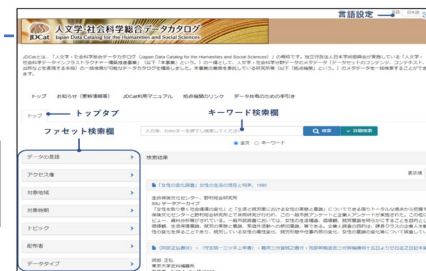
人文学・社会科学総合データカタログ「JDcat」(JSPS)