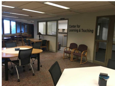
Denison University, Center for Learning and Teaching