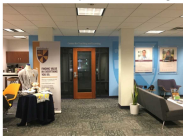
Albion College, Center for Teaching and Learning