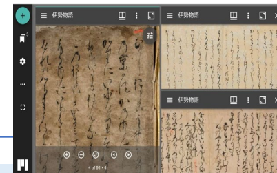
国書データベース (国文学研究資料館)