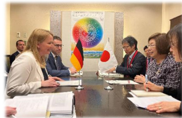
ドイツ ザールラント州、 シュトライヒャート=クリヴォー大臣と