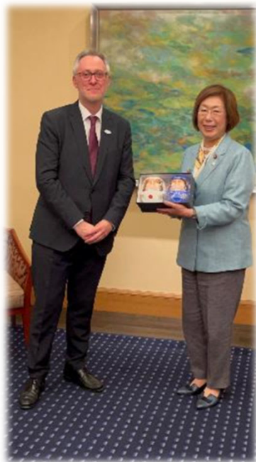
EU、ヘルマンズ局長と