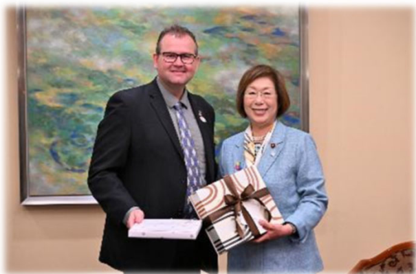
カナダ マニトバ州、 エワスコ大臣と