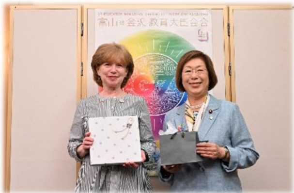
アメリカ、マクローリン教育長官上級顧問と