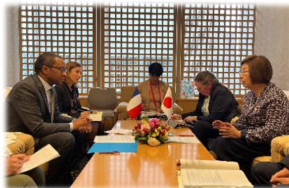
フランス、エンディアイ大臣と