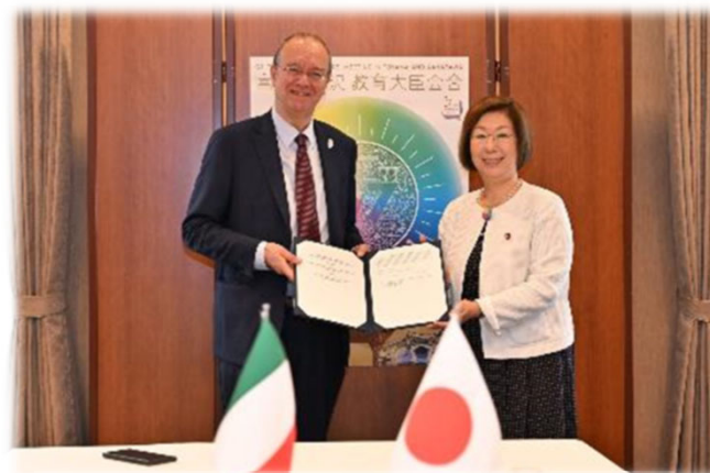
イタリア、ヴァルディターラ大臣と