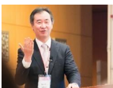
ノーベル賞受賞者の講演