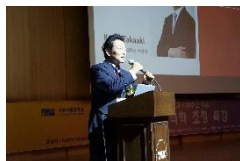
バク JSPS韓国 同窓会会長