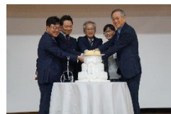
設立10周年記念 セレモニー