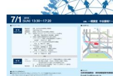
キックオフ・シンポジウムのポスター

日本学術振興会 人文学・社会科学データインフラストラクチャー構築プログラム シンポジウム