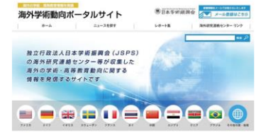
海外学術動向ポータルサイト