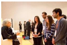
ノーベル賞受賞者と懇談する参加者