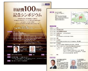
科研費100周年記念シンポジウムポスター

科研費で得られた成果等の効率的な情報発信のため、科学研究費助成事業データベース(KAKEN)や広報誌を活用し、国民に対し広く情報を公開している。