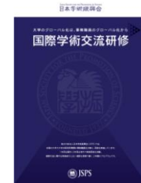
パンフレット 「国際学術交流 研修」