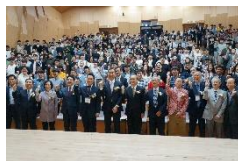
設立10周年記念 シンポジウム