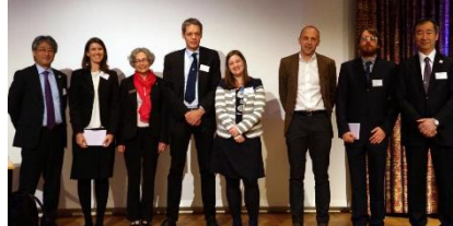
KVA-JSPSセミナー 「New Windows to the Universe」 (平成30年11月)