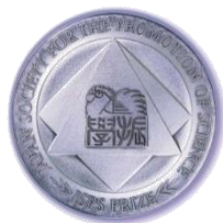
日本学術振興会賞賞牌