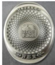
日本学術振興会育志賞賞牌