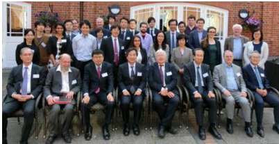
ロンドン研究連絡センター、英国ロイヤルソサエティ(王立協会)共催セミナー (平成30年6月)