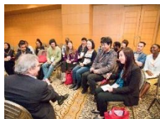
ノーベル賞受賞者とのディスカッション