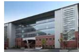
京大オリジナル株式会社