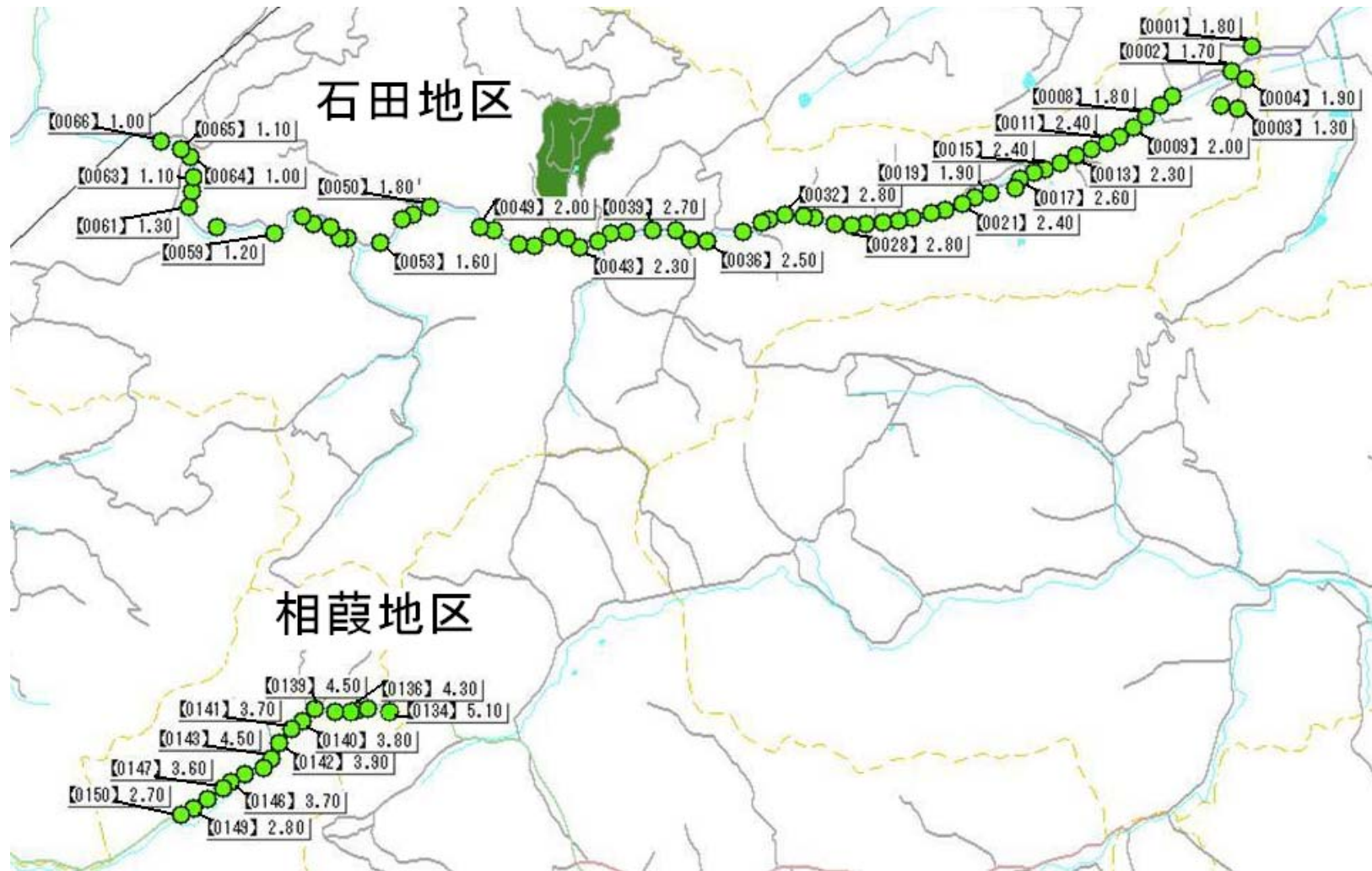
环境辐射监测详细调查(伊达市)道路调查位置图