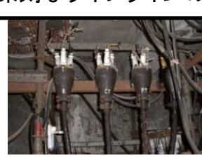
電気ケーブルの劣化