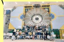
「Bファクトリー」による素粒子物理学研究 (高エネルギー加速器研究機構)