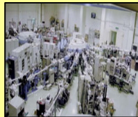
小型放射光で物質科学分野をリードする (広島大学 放射光科学研究センター)