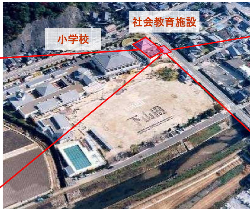
福岡県嘉麻市立下山田小学校