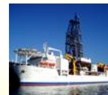
地球深部探査船「ちきゅう」