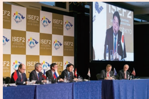
セッション3でパネリストを務める林芳正・文部科学大臣

次回会合（ISEF3）は、2021年（平成33年）までに欧州で開催される予定である。