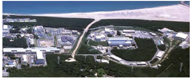
J-PARC センター 提供

平成 13 年：建設着手 平成 20 年：物質・生命科学実験施設の利用開始 平成 21 年：K 中間子ビーム発生成功 →ハドロン実験施設の利用開始 ニュートリノビーム発生成功 →ニュートリノ実験施設の利用開始 平成 23 年：東日本大震災により運転停止 平成 24 年：1 月に J-PARC 施設利用実験再開、 共用法による中性子線施設の共用開始 平成 25 年：5 月にハドロン実験施設の放射性物質 漏えい事故により運転停止 平成 26 年：2 月に物質・生命科学実験施設利用実験再開、 5 月にニュートリノ実験施設利用実験再開 平成 27 年：1 月に 3 GeV シンクロトロンにおいて 1 MW 相当のビーム加速に成功 平成 27 年：1 月に物質・生命科学実験施設（MLF）第 2 実験ホールにおけるミュオン施設からの火災発生により運転停止。 2 月に MLF、ニュートリノ実験施設の利用運転再開、4 月にハドロン実験施設の利用運転再開。 4 月にターゲット容器不具合のため MLF の利用運転休止、10 月に利用運転再開。 11 月にターゲット容器不具合のため MLF の利用運転休止。 平成 28 年：2 月に利用運転再開。