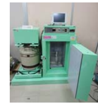
ゲルマニウム 半導体検出器→