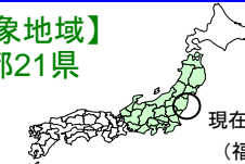
現在の空域モニタリング範囲 (福島県と隣接県の一部)