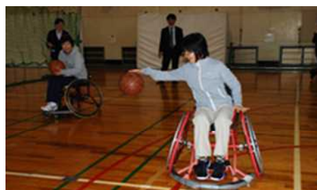
車椅子バスケットボールの体験会

「指導者」については、市区町村職員、スポーツ推進委員、地域スポーツクラブ等を対象に実践的なセミナーを実施し、地域において障害者スポーツを支えるキーパーソンを育成する必要がある。そのために、障害者スポーツ振興において中心的な役割を果たしている(公社)東京都障害者スポーツ協会、(公財)日本障害者スポーツ協会をはじめ、障害者スポーツ関係団体等と連携していくことが望まれる。また、スポーツ推進委員と障害者スポーツ指導員が相互の活動について理解を深め、事業実施の際に連携・協働することが障害者スポーツの振興には必要であると指摘があった。また今後、地域での障害者スポーツ事業の実施体制としては、以下を理想としていた(図表 4-9)。