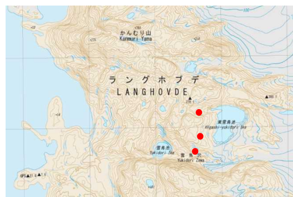
図 ドラム缶が確認された位置（赤丸）