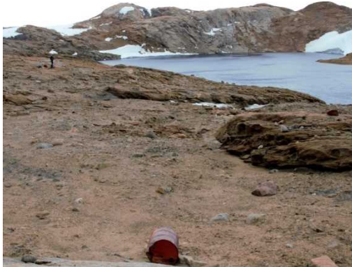
写真 ASPA内のドラム缶

また、ラングホブデ等の各露岩域においては、ドラム缶、飲料缶等の金属片、ガラス片、木屑など、細かな廃棄物を確認した。特に調査拠点となる小屋がある地域周辺では、廃棄物が比較的多く確認されたため、クリーンアップ作業を行うよう検討いただきたい。