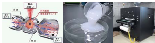
ウォータージェットミル セルロースナノファイバー エレクトロスピニング装置