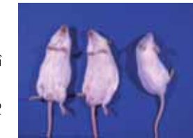
正向反射消失による睡眠延長の確認