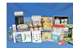
開発された商品群