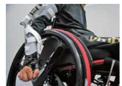
車いす走行を強化する支援ロボット

腕神経叢損傷者および頸髄損傷者は、肘の伸展や屈曲動作を行うのが困難である。本研究では、過剰な支援による機能低下を起さず、残存機能を積極的に用いることで、肘の運動を補助することのできる上肢動作支援ロボット(アクティブギプス)を開発した。具体的には、上肢の屈筋・伸筋の働きをモデル化し、上肢運動中に粘弾性を調節可能とすることで、意志に応じた屈曲・保持・伸展動作支援を可能とした。最終的には、屈曲・伸展運動実験により、提案手法の有効性を示すとともに、被験者の意志通りに上肢動作を実現できることを確認した。