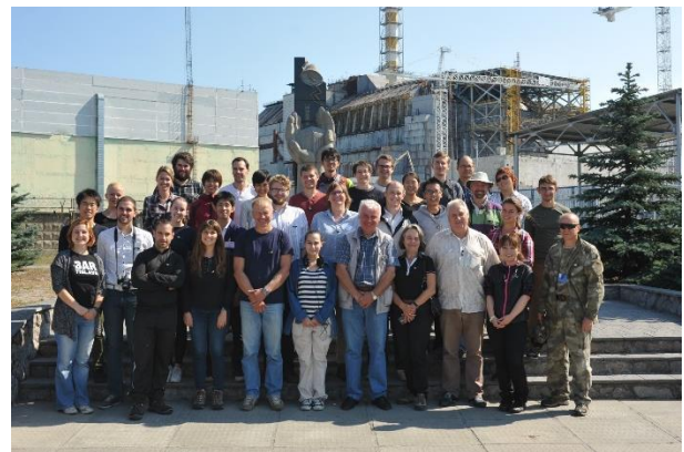
写真 6 原子力災害海外特別実習 (平成 28 年度 チェルノブイリ原子力発電所に て)