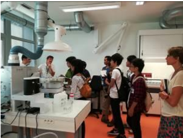
写真 7 原子力災害海外特別実習 (平成 29 年度 IRSN にて)