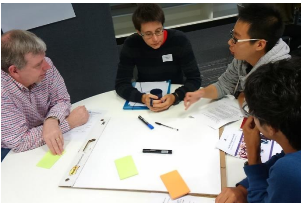
写真 5 原子力災害海外特別実習 (平成 28 年度 リバプール大学にてグループ ディスカッション)