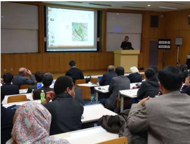
写真 9 キックオフシンポジウム (平成 28 年 3 月 12 日 筑波大学総合研究棟 A)