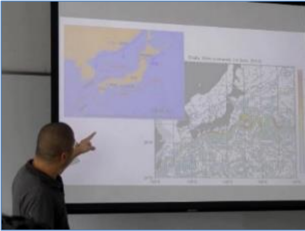
写真 1 原子力災害環境影響評価論 I