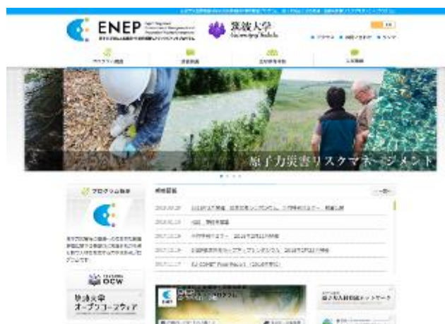
図 2 プログラム Web サイト