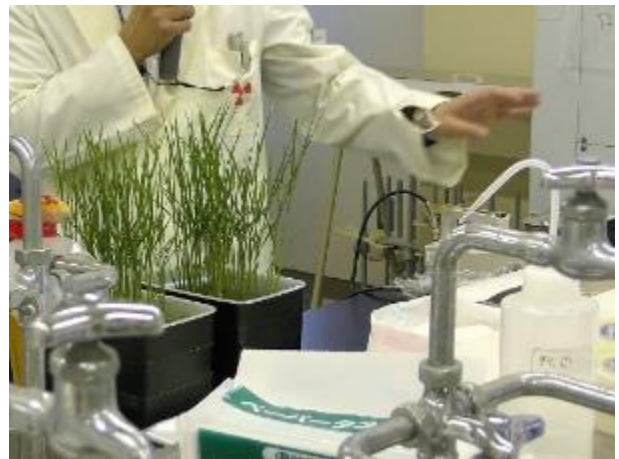
写真 2 環境放射能動態解析論 II の (非密封 RI とオートラジオグラフィーを用いた 植物体中の放射性セシウムの動態評価の実習)