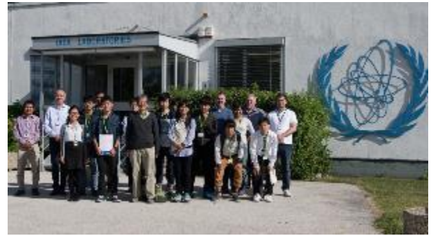
写真 8 原子力災害海外特別実習 (平成 29 年度 IAEA にて)