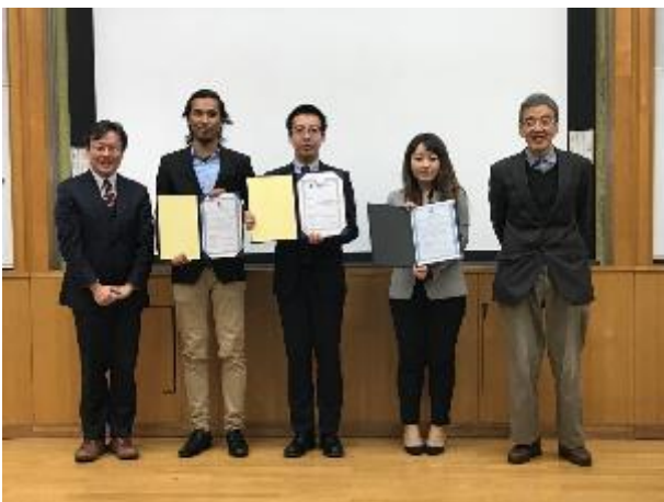
写真 11 ラップアップシンポジウム プログラム 修了証授与 (平成 30 年 2 月 22 日 筑波大学総合研究棟 A)