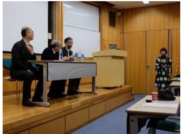
写真 10 ラップアップシンポジウム パネルディスカッション (平成 30 年 2 月 22 日 筑波大学総合研究棟 A)