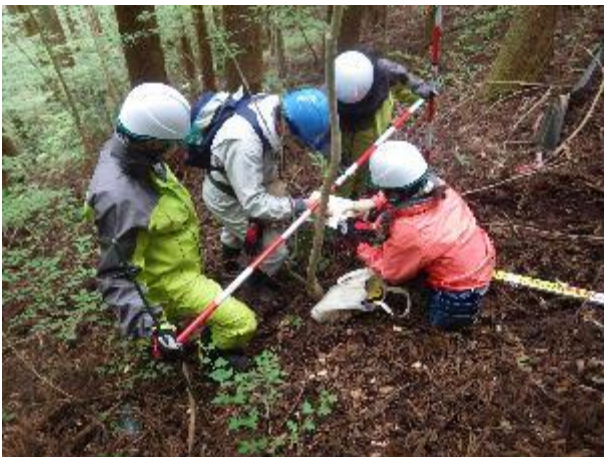
写真 3 環境放射能リスク評価インターンシップ (日本原子力研究開発機構)